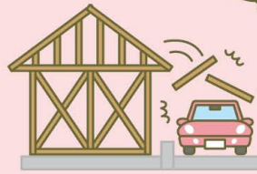
請負賠償責任保険